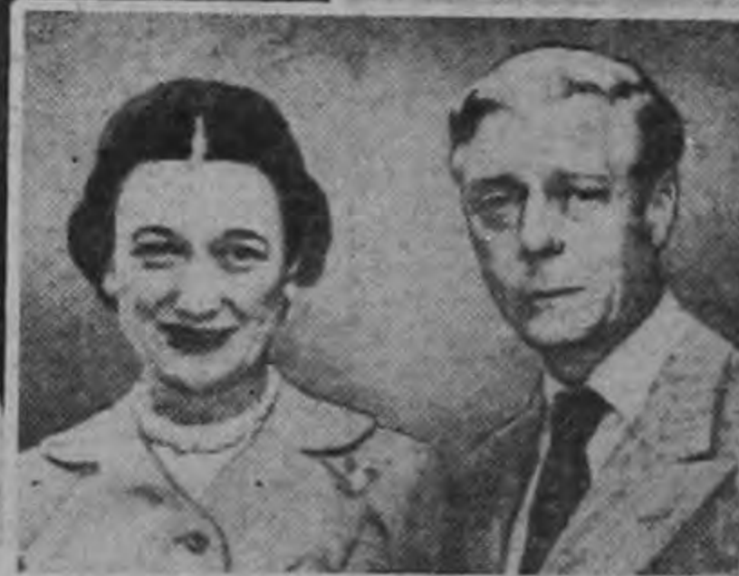
Defied tradition for "the woman I love."

OTRO IDILIO REAL ¿ES LA SOBRINA IGUAL AL TIO?— Mientras el Parlamento discute el acta de la regencia que envuelve los matrimonios de la familia real, en Londres, mucho se habla respecto a si la Princesa Margarita renunciará a algunas de sus prerrogativas para contraer matrimonio con el plebeyo divorciado capitán Peter Townsend... y seguir así los pasos de su tío, el ahora Duque de Windsor que abdicó al trono por Wallis Simpson (en el recuadro) una divorciada norteamericana. (INP)