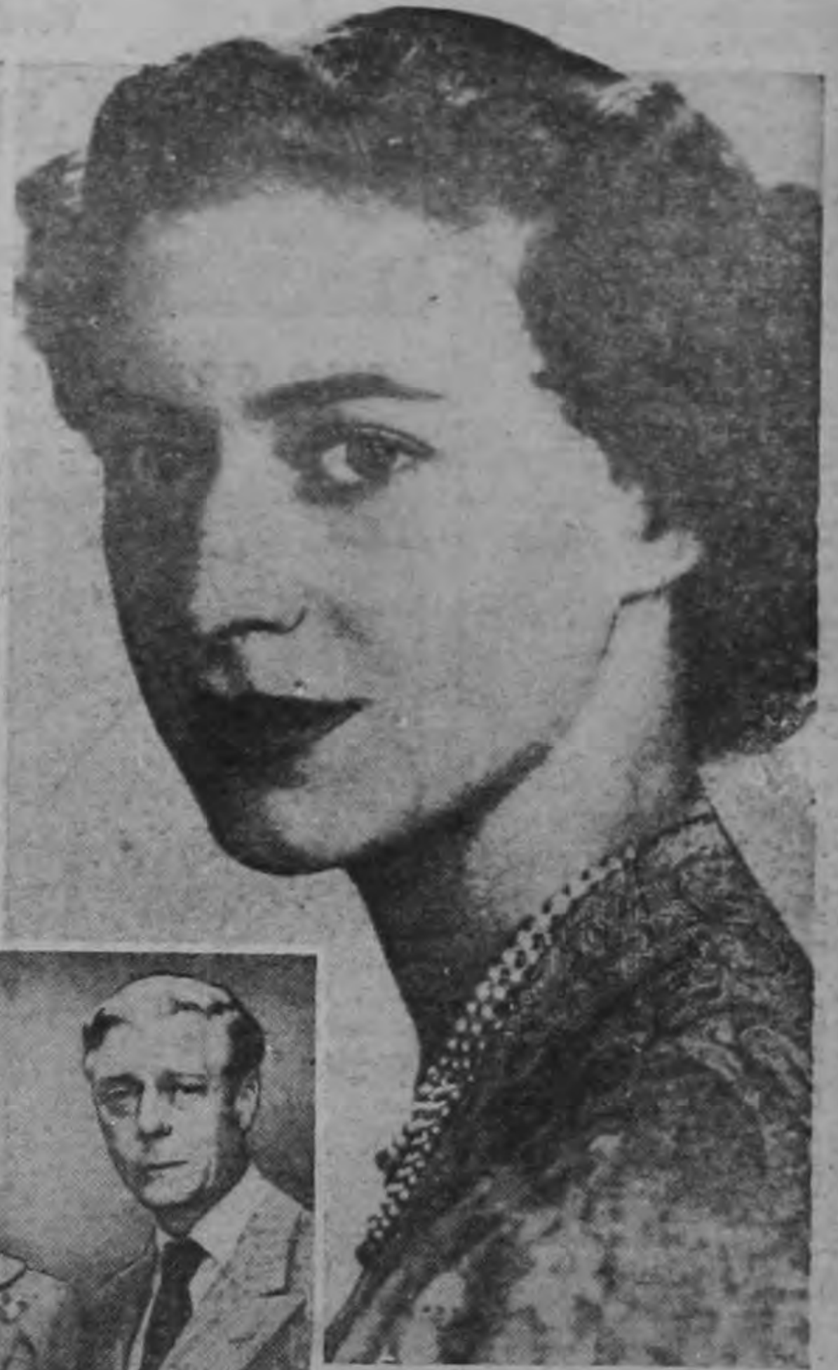
Princess Margaret Rose