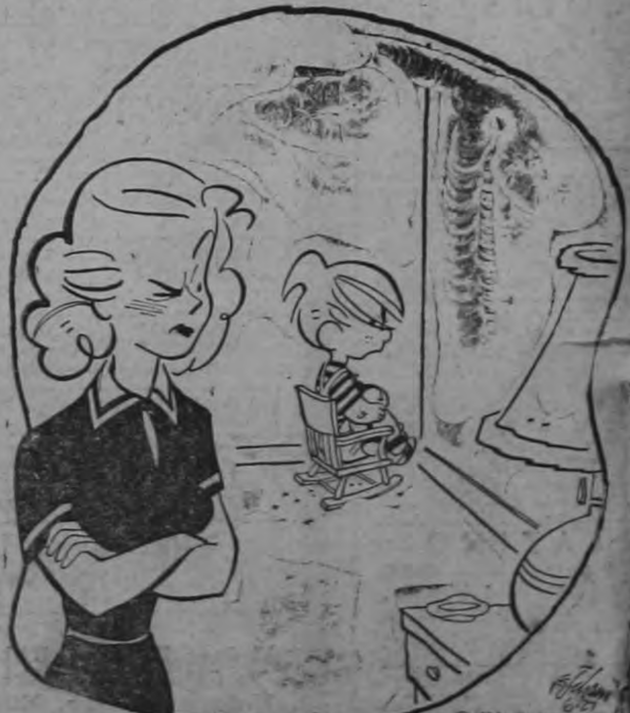
Pues tú te reíste cuando llamé a papá "gordinflón".